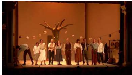
(Imágenes y vídeo promocional del Teatro de La Abadía)