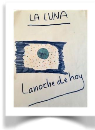
(Ilustración de Eva Corchado Maseda)