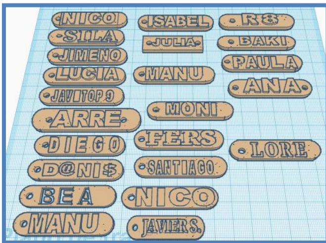
Archivo con el nombre de alumnos antes de imprimirlos