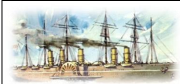
Barco de Vapor

7.- En diferentes etapas de su viaje Phileas Fogg viaja en barco. Barcos hay muchos y no todos son iguales. Describid cómo eran los que utilizó Fogg.